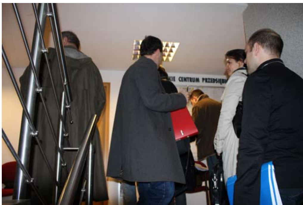
Fot. Ostatni dzień naboru wniosków o dofinansowanie dla mikroprzedsiębiorstw. Wnioskodawcy czekają w kolejce do MCP, żeby złożyć swoje projekty.

Obecnie trwa ocena formalna złożonych projektów. Ostatecznych wyników konkursu możemy spodziewać się na początku przyszłego roku. Pozytywny jednak wydaje się być fakt, że wśród małopolskich przedsiębiorców jest coraz większa świadomość udziału funduszy europejskich w rozwoju gospodarczym regionu.